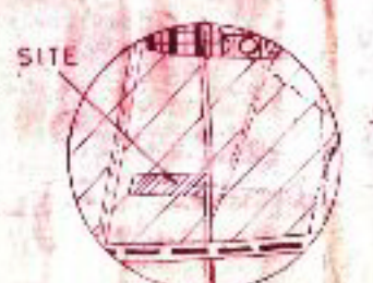
SITE LOCATION IN MASTER PLAN